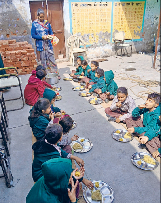
भिवानी। दोपहर के वकत भोजन के बाद बच्चों में पीन्नी वितरित करते हुए।

अप्रैल के बाद न तो गेहूं पहुंचा, न दूध का पाऊंडर सूत्र बताते हैं कि नया शैक्षणिक सत्र अप्रैल से शुरू हुआ। अप्रैल शुरू होते की स्कूल मुखियाओं ने