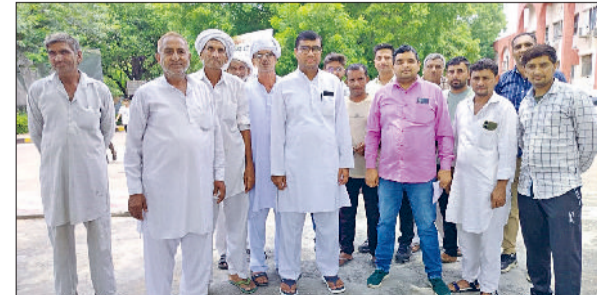
भिवानी। पानी की निकासी की मांग को लेकर समाधान शिविर में जाते गांव बड़ेसरा के लोग।

के नेतृत्व में सोमवार को बड़ी संख्या में ग्रामीण समाधान शिविर पहुंचे। समाधान शिविर में उन्होंने उपायुक्त