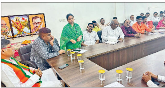
भिवानी। हर घर तिरंगा को लेकर आयोजित बैठक को संबोधित करते हुए।