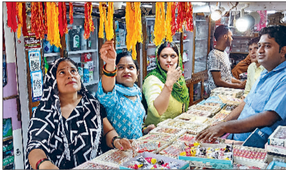
भिवानी। बाजार में दुकान पर लगी स्टॉल पर राखी खरीदती महिलाएं।

शनिवार नौ अगस्त को भाई बहन का पवित्र रक्षाबंधन का त्योहार मनाया जाएगा, जिसमें बहन अपने भाई की कलाई पर रक्षा कवच के रूप में राखी बांधेगी और भाई बहन को आशीर्वाद स्वरूप उपहार व उसकी सुरक्षा का वचन देगा। वर्ष 1930 के वैदिक पंचांग गणना के अनुसार शनिवार नौ अगस्त के दिन ही राखी का त्योहार श्रावण नक्षत्र शम चार बजकर 41 मिनट तक था और अब एवं बालव करण के संयोग थे। अब 95 साल बाद राखी का त्योहार समान दिन एवं समय, नक्षत्र एवं योग में पुनः मनाया जाएगा। इस बार कोलकाता की जरी बुटी, कुंदन, चंदन व स्पेशल नगवाली राखियों की बाजार में धूम मची हुई है। वहीं भगवान गणेशजी, भगवान शिव,