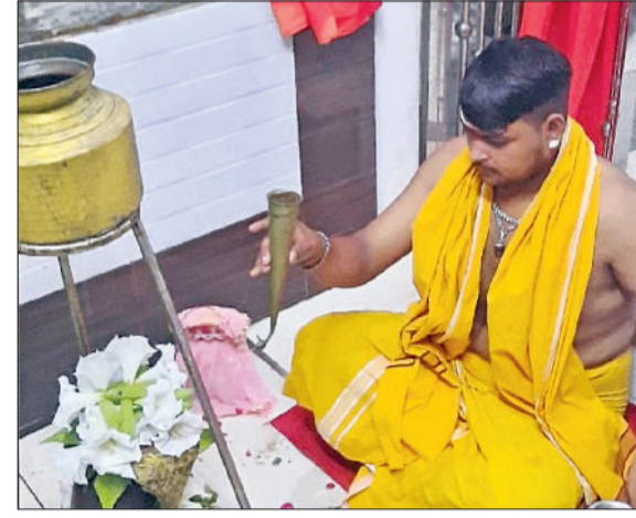
भिवानी। शिवलिंग पर जलाभिषेक करते पुजारी।