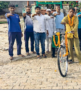
भिवानी। गांव प्रेमनगर में स्वच्छता व पर्यावरण सुरक्षा की शपथ लेते ग्रामीण।

सादे व सार्थक समारोह में गांव की सफाई व्यवस्था को बेहतर बनाने के लिए गांव के सफाई कर्मचारियों को