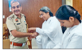
भिवानी। पुलिसकर्मियों को राखी बांधती ब्रह्माकुमारी बहने।